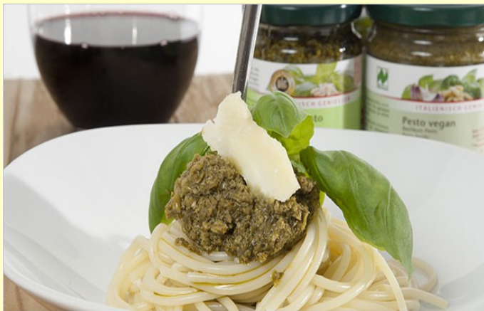
Des sauces et du pâté