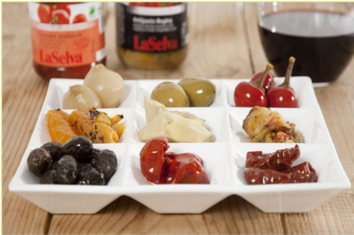
Des antipasti (entrées)